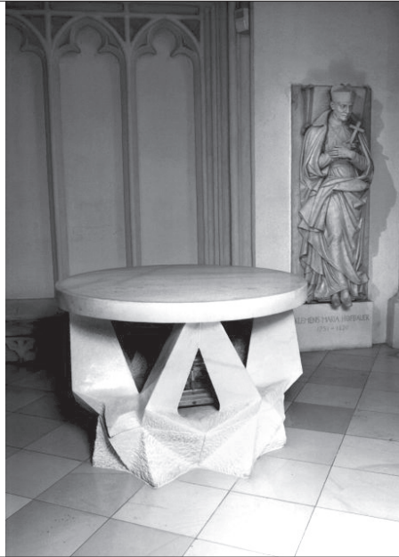
Ołtarz z relikwiami św. Klemensa w kościele Maria am Gestade, Wiedeń